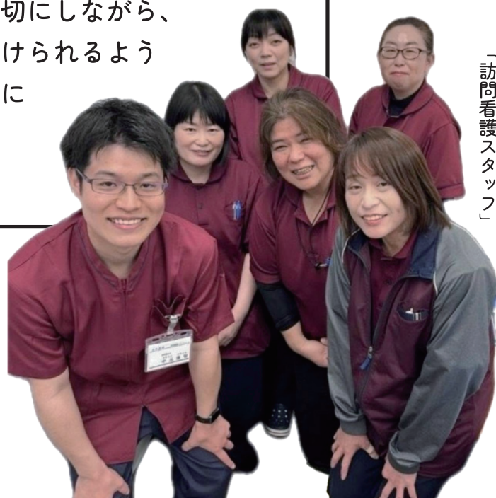
「訪問看護スタッフ」

「買い物に行きたい」、「庭の手入れを続けたい」、 「転ばずに歩きたい」、そんな思いを大切にしながら、 住み慣れたご自宅で安心して生活を続けられるよう 支援しています。地域の皆さまのお力に なれるよう努めてまいりますので、 どうぞよろしくお願いいたします。